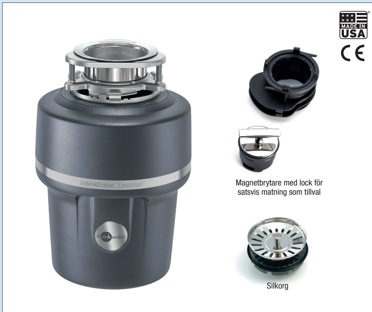
Magnetbrytare med lock för satsvis matning som tillval