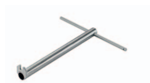
Losstagningsverktyg för malverk

Disperators kvarnar används i kök, på land och till sjöss världen över, för att i den stund matavfall uppstår snabbt och enkelt bli kvitt detta och därmed undvika ineffektiv och ohygienisk manuell hantering.