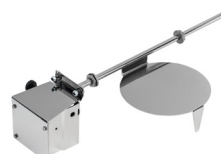
Skyddslock över kvarn- inlopp i disklåda/diskbana