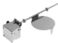
Skyddslock över kvarninlopp i disklåda/diskbana