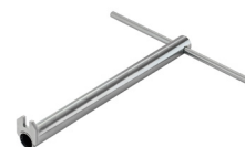
Losstagningsverktyg för malverk

För utomhusinstallation i havsvattenmiljöer, se våra produktblad för 500RS-serien som standard inkluderar det ytterhölje och installationsmontage av syrafast rostfritt stål EN1.4401/ AISI316.